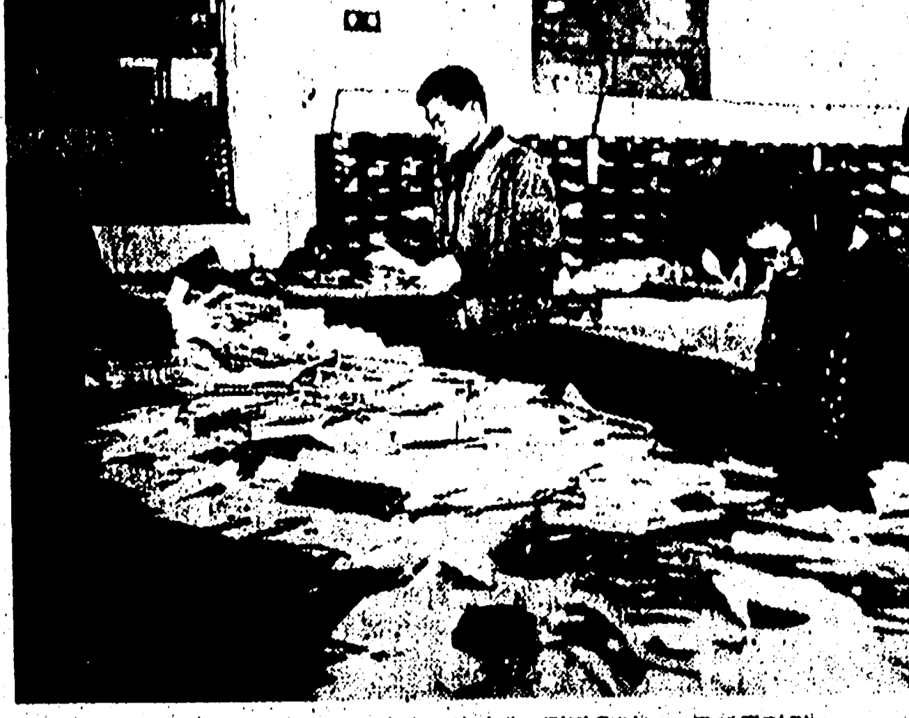
이런모든 부활은 연이장-정리에 진달되는 부활의리인

【本報訊】大邱地方法院檢察處，於昨日(廿七日)下午，在該地某處，將一名涉嫌在該地發生之「手配한 차」(手配車)案之嫌犯，予以逮捕。該名嫌犯，係在該地某處，被警方發現，其手配之車輛，係在該地發生之「手配한 차」案之證據。該名嫌犯，在逮捕時，曾表現出不安之舉，但其律師，則對其當事人之自由，表示樂觀。此外，該名嫌犯之律師，並積極收集旁證，以證明其當事人之清白。據悉，該名嫌犯，係在該地某處，被警方發現，其手配之車輛，係在該地發生之「手配한 차」案之證據。該名嫌犯，在逮捕時，曾表現出不安之舉，但其律師，則對其當事人之自由，表示樂觀。此外，該名嫌犯之律師，並積極收集旁證，以證明其當事人之清白。