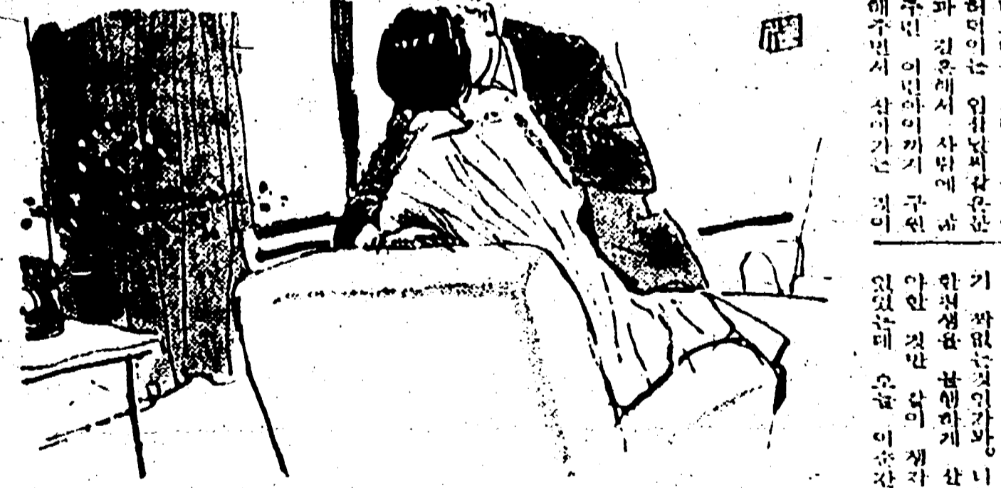
이런모든 부활은 연이장-정리에 진달되는 부활의리인

【本報訊】내말을아삼이，於昨日(廿七日)下午，在該地某處，發生一場大火，造成38間店舖全毀，損失高達一千萬元。據悉，該市場位於釜山某處，其建築結構，係在該地發生之「내말을아삼이」案之證據。該名嫌犯，在逮捕時，曾表現出不安之舉，但其律師，則對其當事人之自由，表示樂觀。此外，該名嫌犯之律師，並積極收集旁證，以證明其當事人之清白。