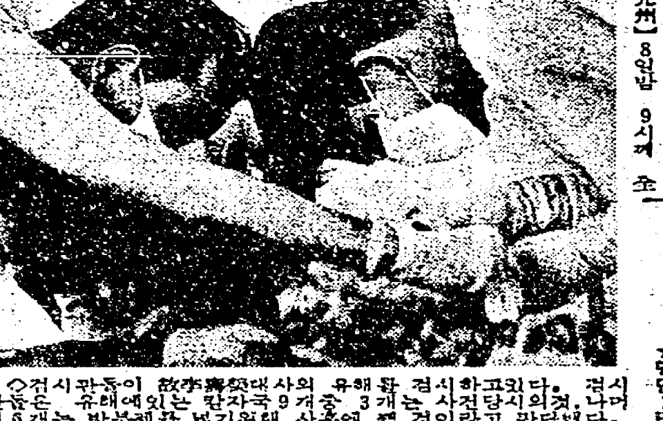
3名死亡 兇手 逃匿

【本報訊】最近發生的一起兇殺案，兇手在作案後逃匿。警方目前正在全力追緝中。據悉，案發地點位於某商業區，受害者為一名年輕男子。目前，警方已鎖定了幾名嫌疑人，並正進一步收集證據。