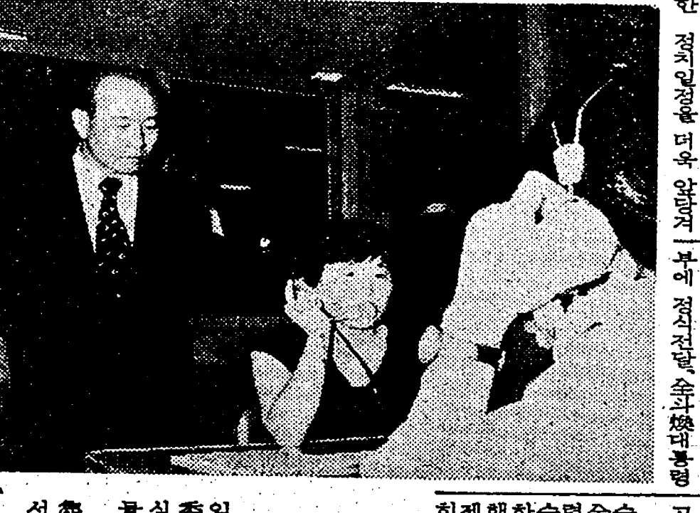
全斗煥의 勝選을 축하하는 官廳 要員들

全斗煥 당선談話 全斗煥은 韓國의 民主政體를 繼承하고 韓國의 民主政體를 發展시키는데 最善한 政府를 造成할 것이다. 全斗煥은 韓國의 民主政體를 發展시키는데 最善한 政府를 造成할 것이다. 全斗煥은 韓國의 民主政體를 發展시키는데 最善한 政府를 造成할 것이다.